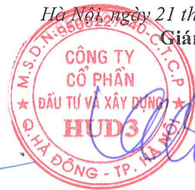
Vương Đăng Phương