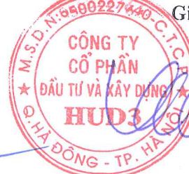
Vương Đăng Phương