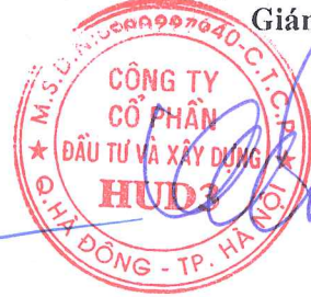
Vương Đăng Phương